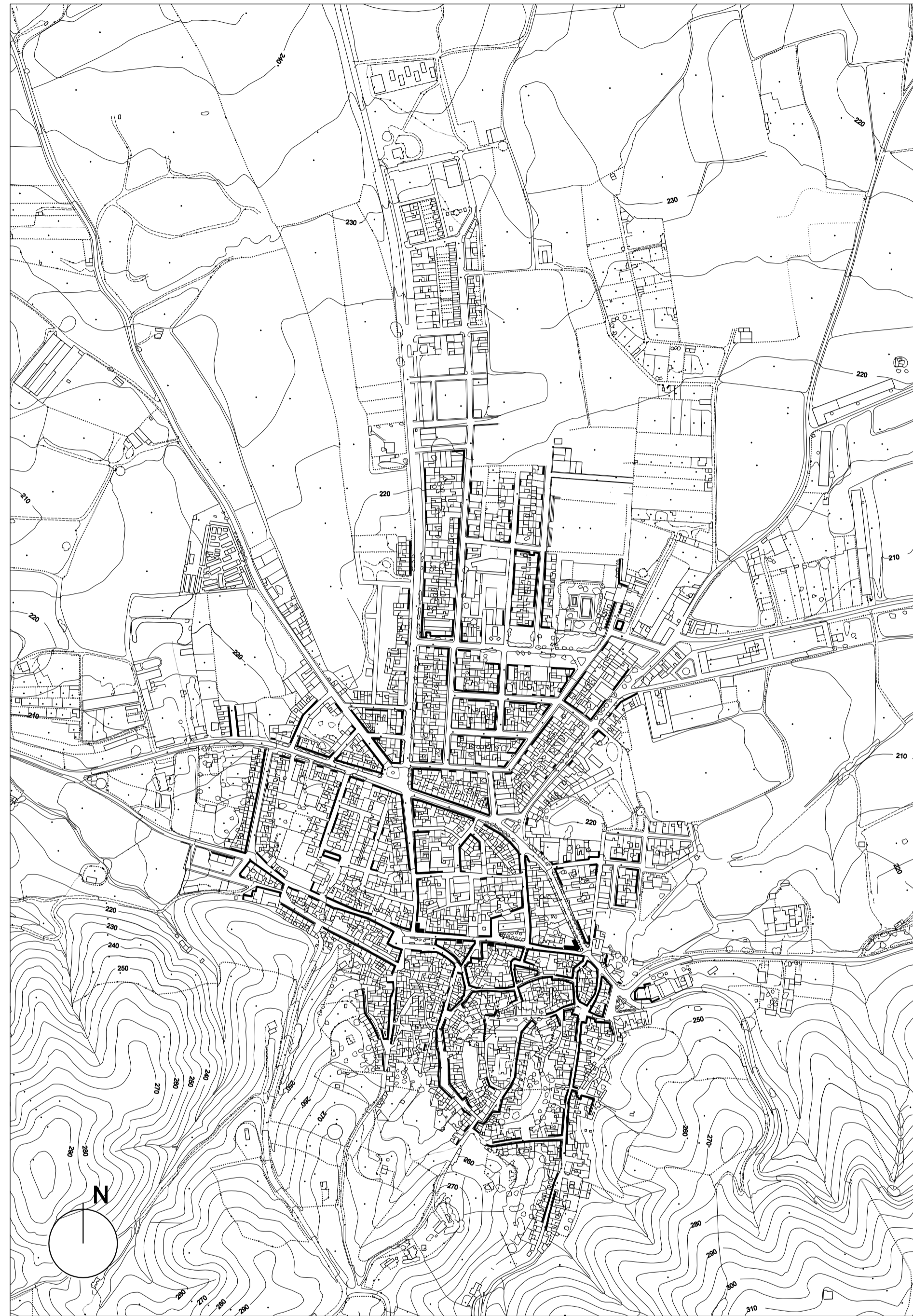
ALTURA DE LA EDIFICACION